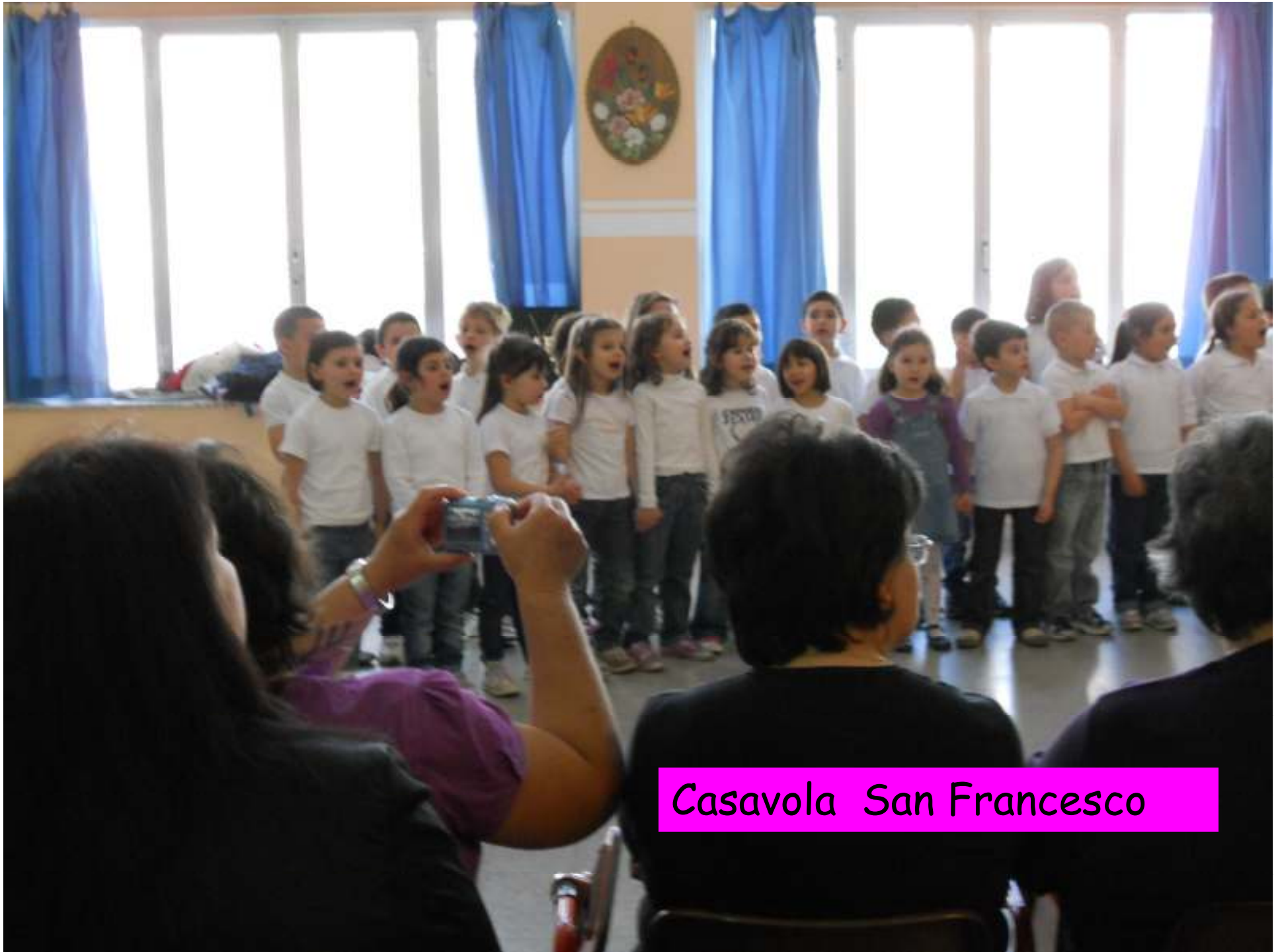
Casavola San Francesco