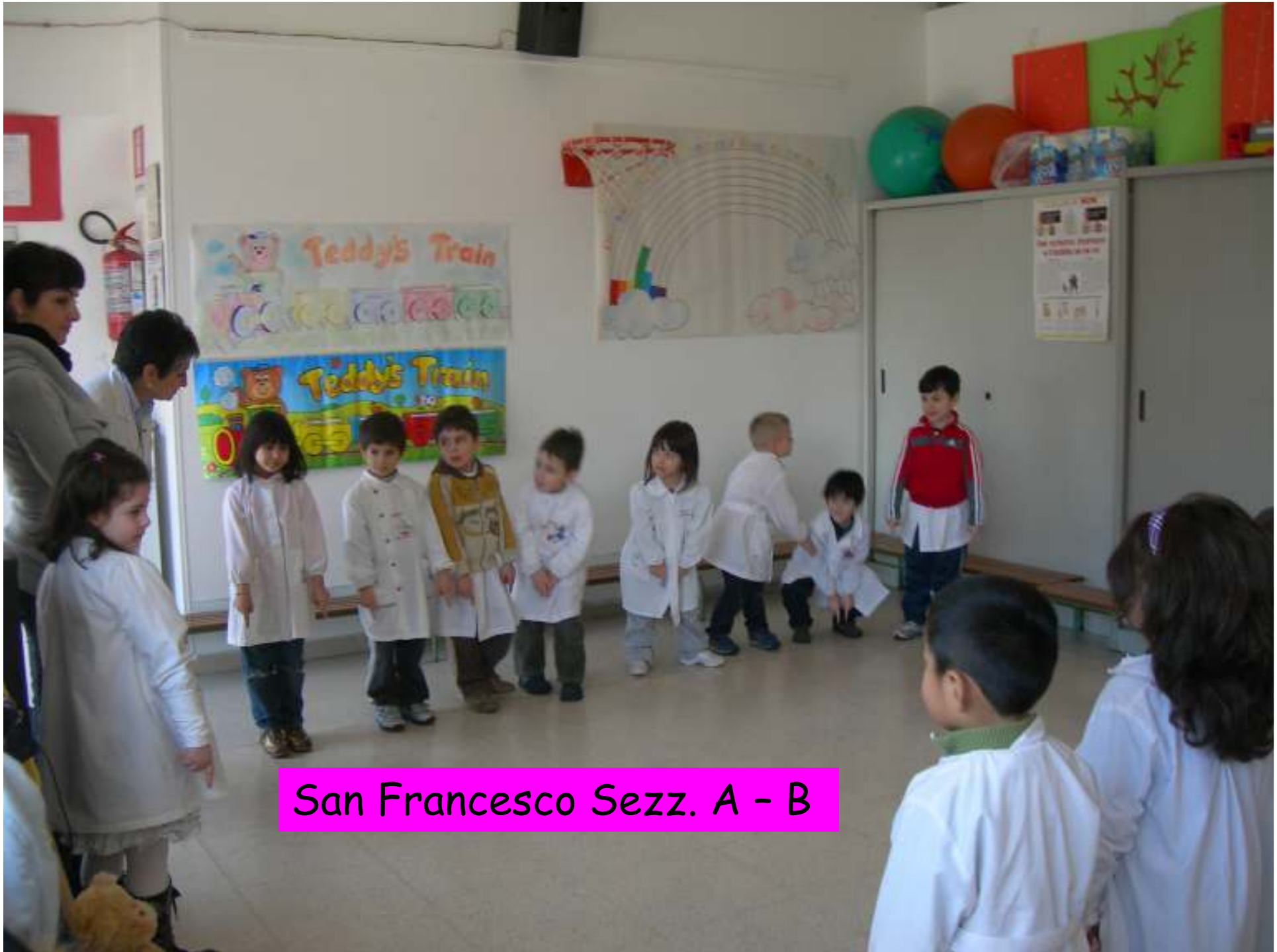
San Francesco Sezz. A - B