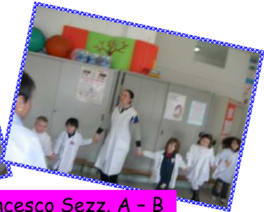
San Francesco Sezz. A - B