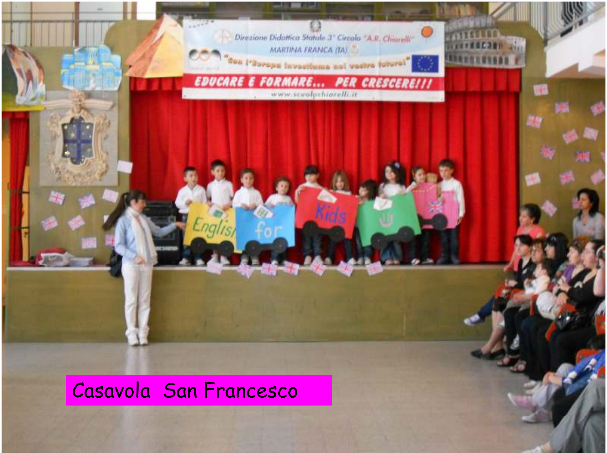
Casavola San Francesco