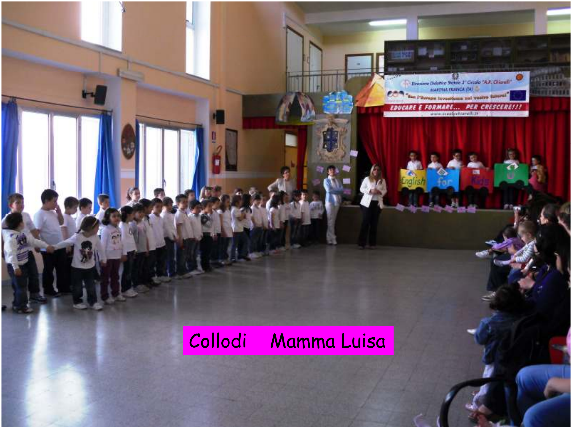
Collodi Mamma Luisa