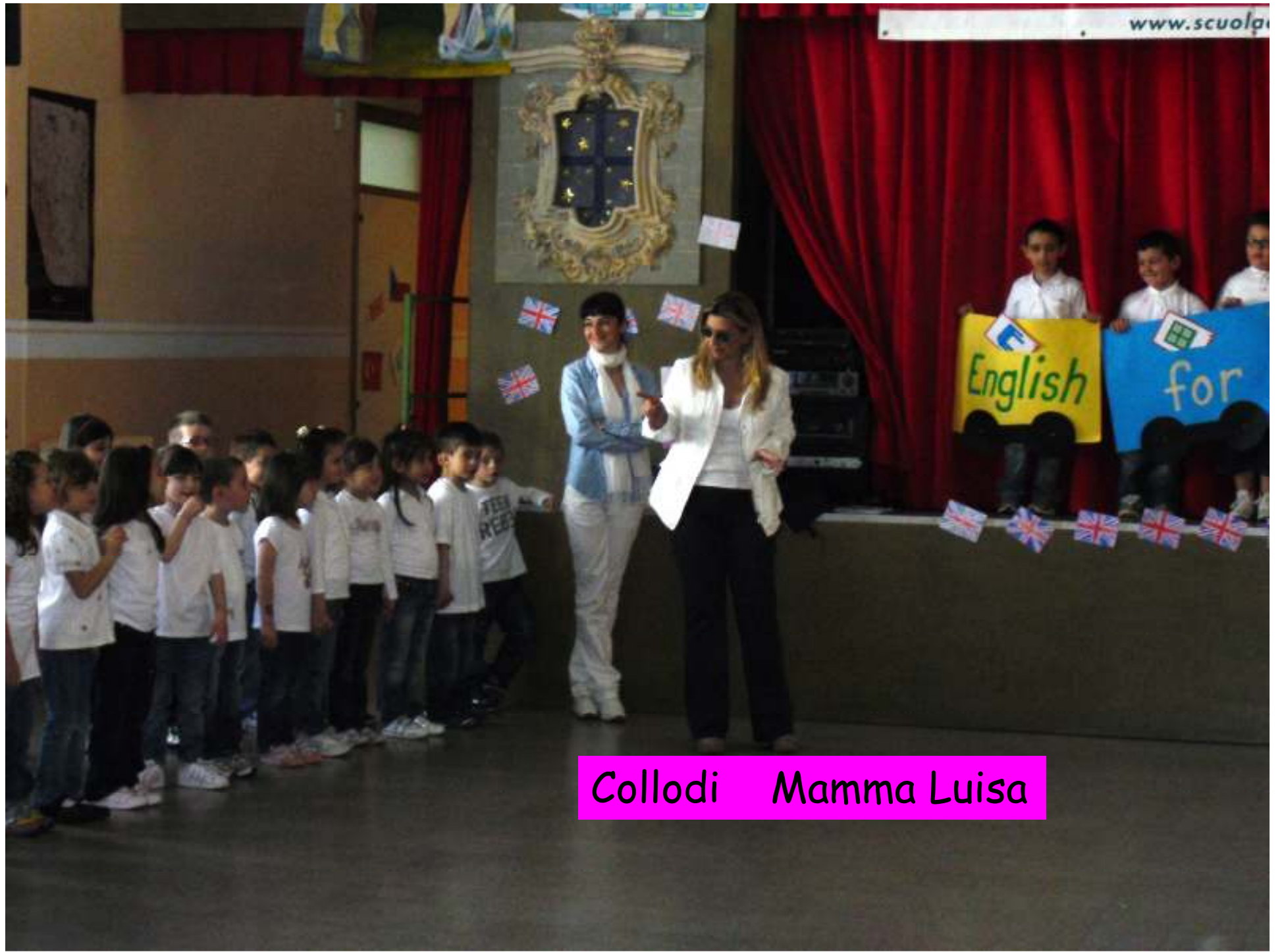
Collodi Mamma Luisa