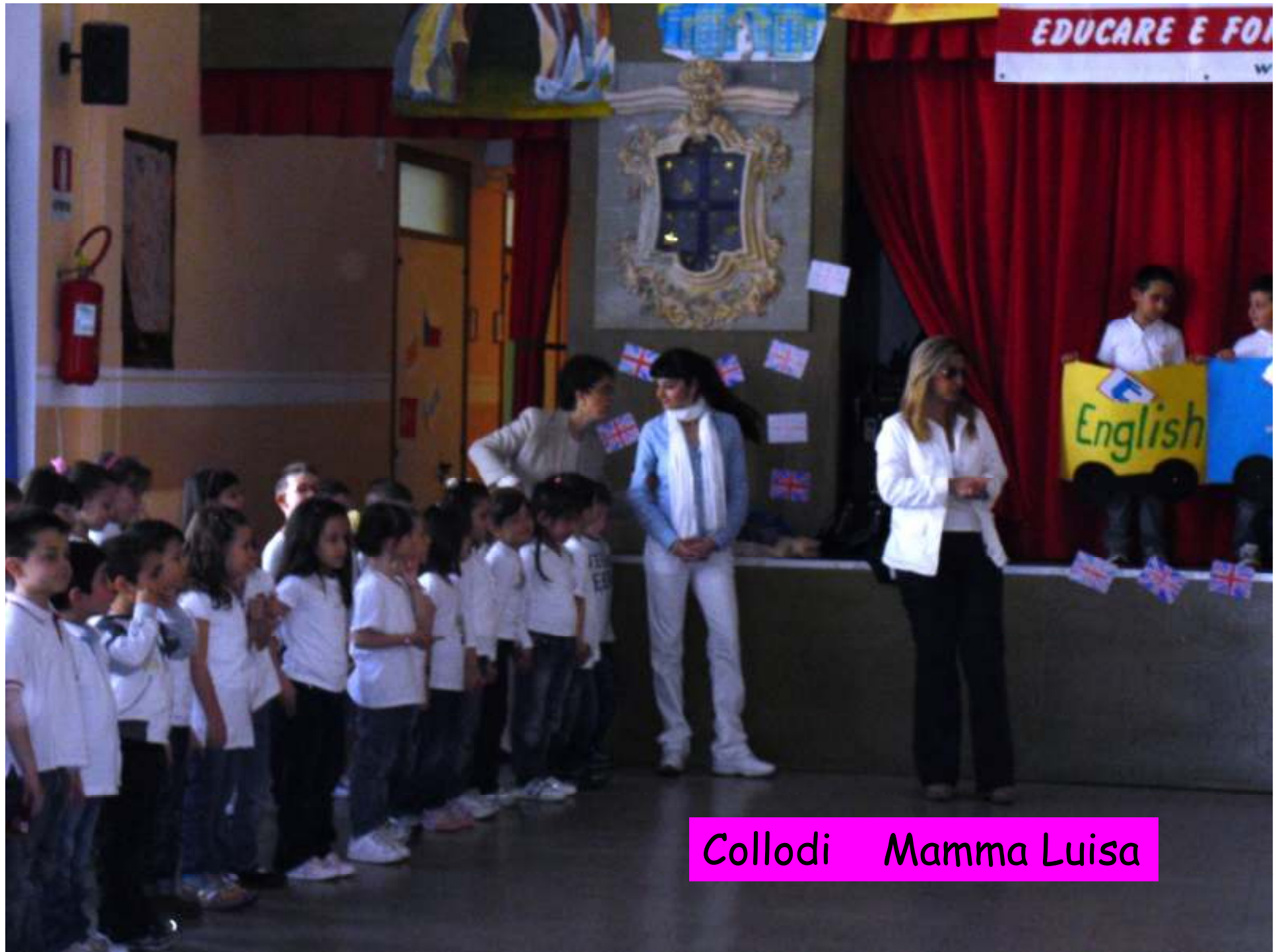
Collodi Mamma Luisa