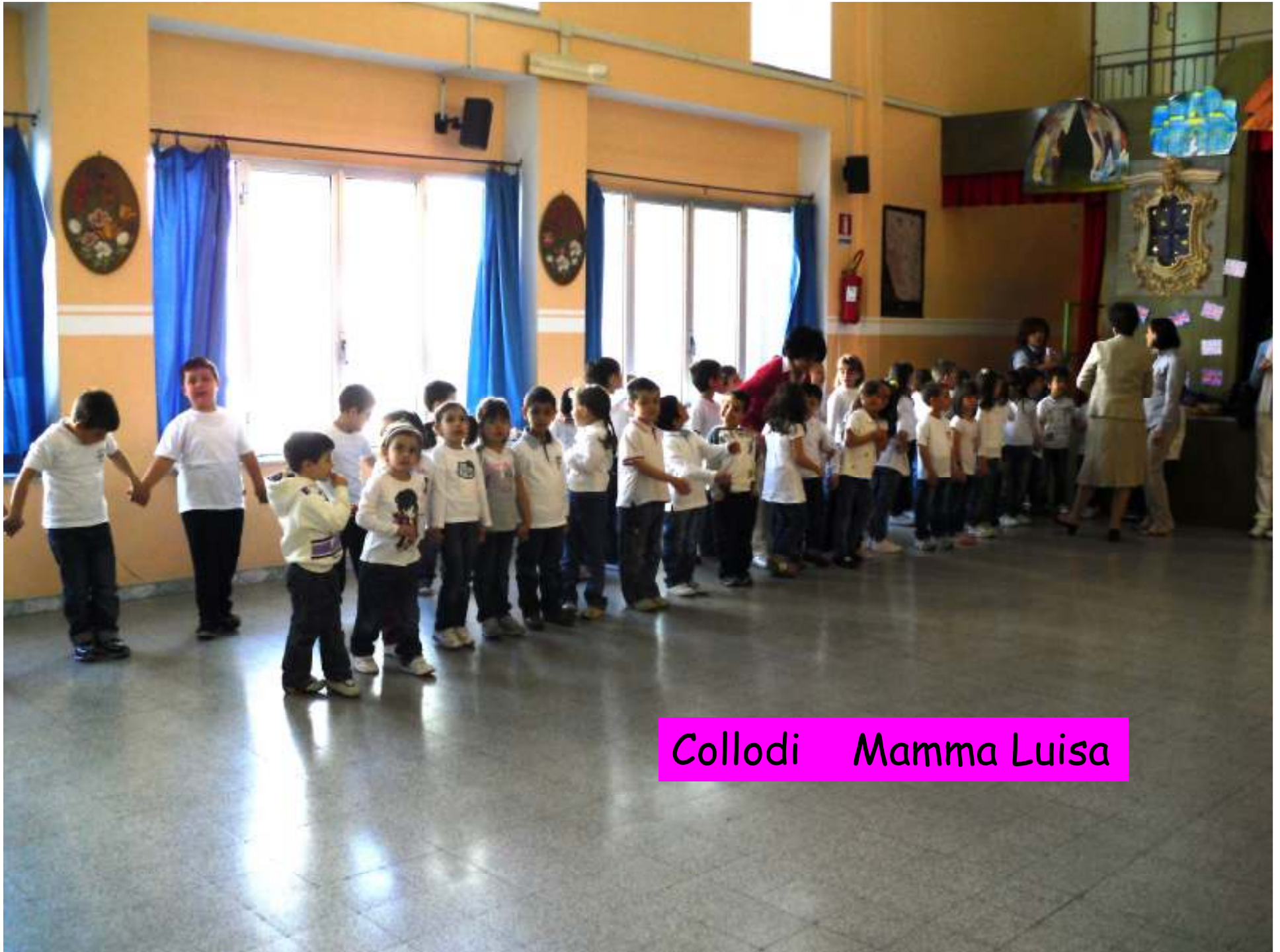
Collodi Mamma Luisa