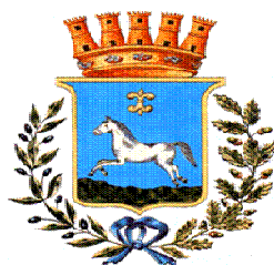
Comune di Martina Franca