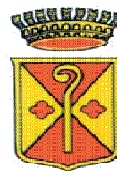
Comune di Cisternino

Con la collaborazione dei LIONS CLUB Martina Franca " Valle d'Itria " e l'Associazione SPLENDIDA DIMORA di Cisternino.