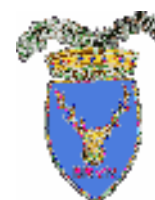
Provincia di Brindisi